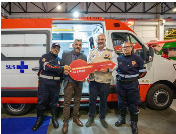
Entrega amplia a capacidade de atendimento de urgência e emergência

A Prefeitura de Santana de Parnaíba recebeu duas novas ambulâncias para o SAMU, reforçando o atendimento de urgência e emergência no município. A entrega ocorreu durante a 17ª Caravana Federativa em São Paulo, evento que reuniu autoridades federais e representantes de diversos municípios do estado. A ação integra o processo de fortalecimento dos serviços de saúde e renovação da frota do município.