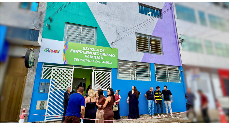
Escola de Empreendedorismo amplia capacitação em Barueri