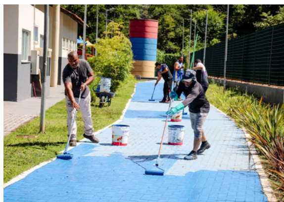
Ações do programa Bairro Limpo levam mais serviços de limpeza nos bairros

A Prefeitura de Santana de Parnaíba realizou ações do programa Bairro Limpo nos bairros Refúgio dos Bandeirantes e Suru. No Refúgio dos Bandeirantes, a iniciativa contou com a chegada do novo caminhão varredor, que percorre as ruas reforçando a limpeza urbana, além de serviços de poda de árvores, pintura e sinalização viária, limpeza de bocas de lobo e revitalização