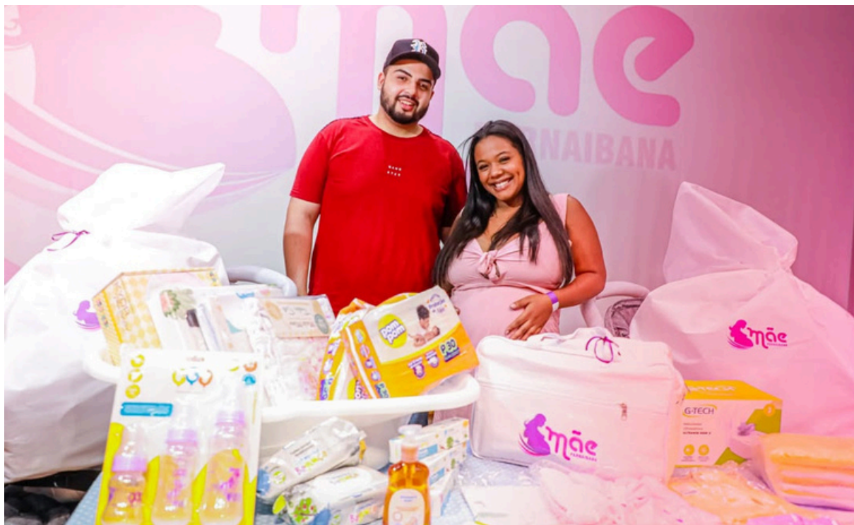
Entrega de kits do programa Mãe Parnaibana, reforça o cuidado com as gestantes do município e garante apoio nesse momento importante da maternidade

Ação garante apoio às futuras mães e fortalece o atendimento à saúde materno-infantil na cidade