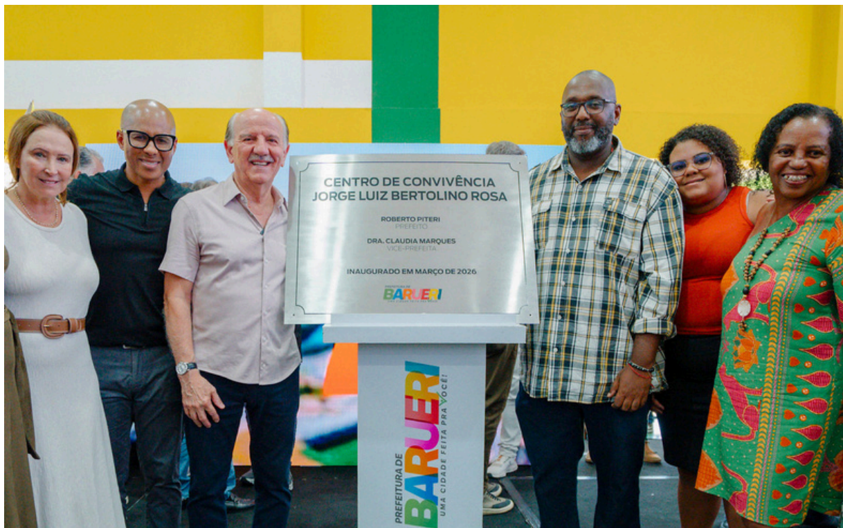
Beto Piteri inaugura o Centro de Convivência “Jorge Luiz Bertolino Rosa”, reforçando o compromisso com mais investimentos para a população de Barueri

Durante o evento, o prefeito Beto Piteri destacou: “O Centro de Convivência do Jardim São Pedro nasce pra ser um ponto de encontro do bairro, com atividades para todas as idades. Aqui tem aprendizado, lazer e oportunidades, com salas, quadra, oficinas e cursos