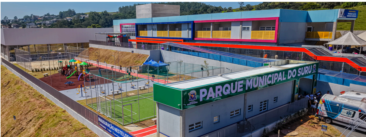
Estrutura do novo Colégio no Suru conta com 12 salas, berçários, salas multifuncionais, quadra coberta e áreas administrativas, garantindo ensino integral com conforto