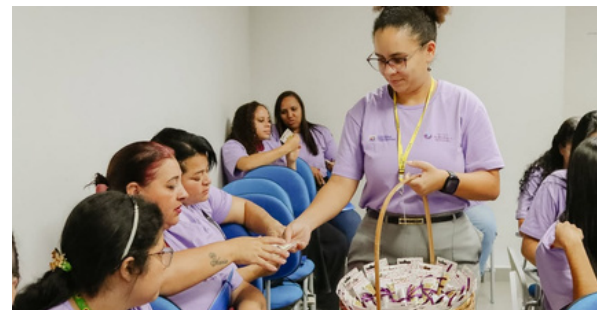
Santana de Parnaíba reforça o enfrentamento à violência contra a mulher

Ao final da atividade, as participantes participaram de um coffee break e puderam compartilhar experiências e promover integração. A ação faz parte da campanha Março Lilás – Elas por Elas, que reforça a importância da prevenção.