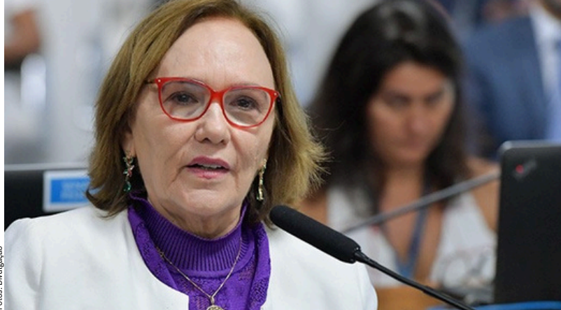
Senadora Zenaide Maia, é relatora do Projeto de Lei nº 935, de 2022, que institui o dia 17 de outubro como o Dia Nacional de Luto e Memória às Mulheres Vítimas de Feminicídio

O crescimento do feminicídio pode estar relacionado ao modo de registro da ocorrência ao longo dos anos, conforme destaca a diretora executiva do FBSP, Samira Bueno. Desde o início da pandemia da Covid-19, houve um expressivo aumento nos